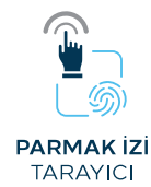
PARMAK İZİ TARAYICI